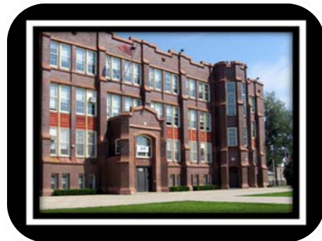
Mirta Ramírez Computer Science High School