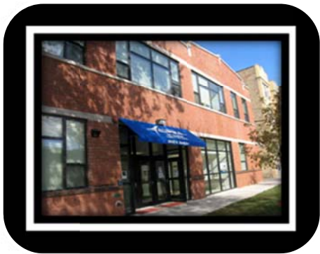
ASPIRA Early College High School