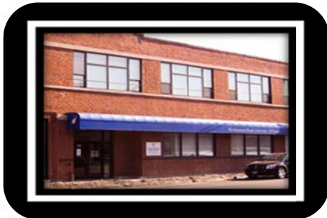
Antonia Pantoja Alternative High School