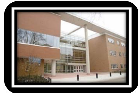
Haugan Middle School